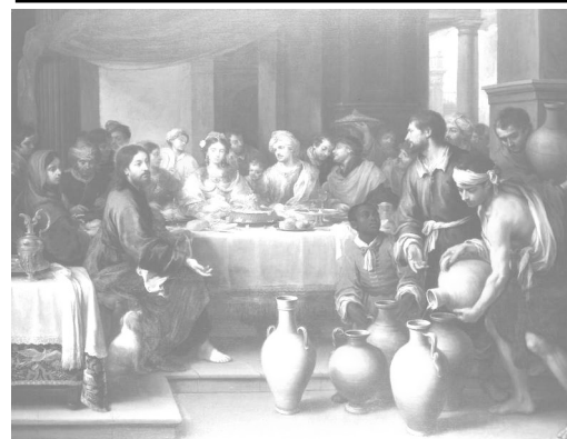
Bartolome Esteban MURILLO, Svadba u Kani , 1672., Barber Institut za likovne umjetnosti, Birmingham, Engleska